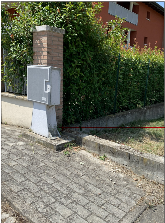
CAPOSALDO INDIVIDUATO SULLA MURA DI CONFINO IN ADERENZA AL PILASTRO DEL LOTTO LIMITROFO